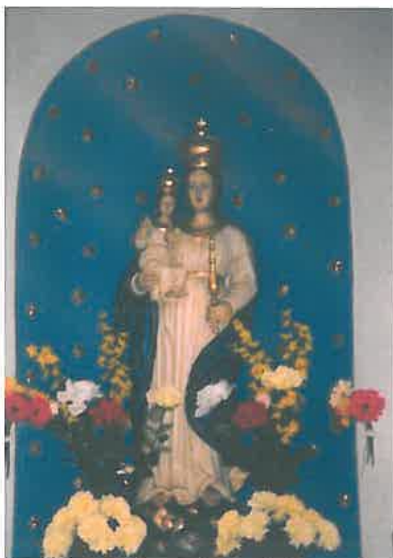
Słynąca z cudów figura wardęgowska

W listopadzie 1939 r. hitlerowcy spalili kaplicę, wcześniej jednak figurę Matki Bożej zdołano przenieść do kościoła w Ostrowitem, dzięki czemu ocalała.