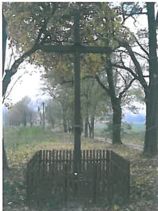
Drewniany przydrożny krzyż

Cmentarz wojskowy z 1812 r. (wojny napoleońskie), obecnie nieczynny (parafia Ostrowite)