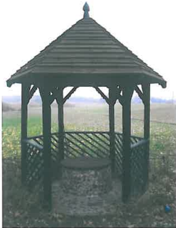
Kaplica wejście, studnia – zdjęcie grupa projektowa