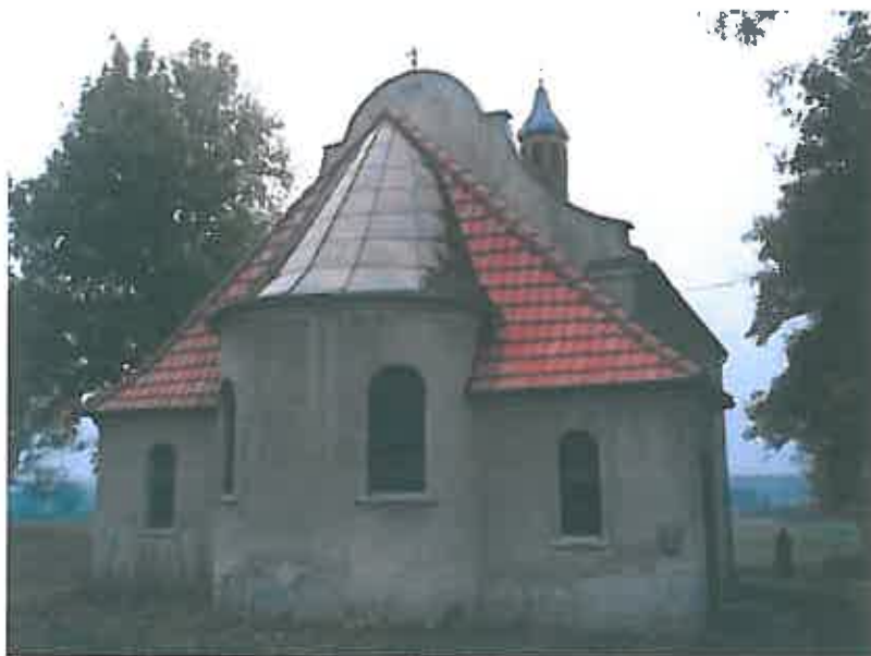
Kaplica widok od strony drogi, zbliżenie – zdjęcie grupa projektowa

Kaplica murowana z cegły, na kamiennej podmurówce, otynkowana. Prostokątny korpus z pseudotranseptem i półkoliście zamkniętym prezbiterium. Od frontu do korpusu przylega kruchta wejściowa. Ściany boczne korpusu – trójosiowe, w transepcie dwuosiowe. Osie wyznaczone przez otwory okienne zamknięte półkoliście. Kaplica kryta dachem dwuspadowym osobnym dla korpusu, transeptu i kruchty (dachówka karpiówka ułożona w koronkę). Wnętrze kaplicy nakryte stropem płaskim. Wyposażenie kaplicy współczesne.