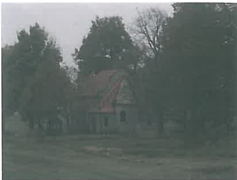
Kaplica widok od strony drogi