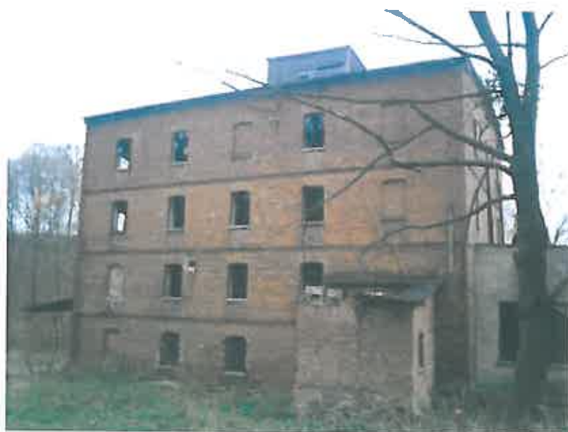
Widok od strony ulicy-zdjęcie grupa projektowa

Stary młyn. Dziś już nie czynny, z jego dawnej świetności nie pozostało już nic oprócz murów oraz kilku instalacji w środku budynku.