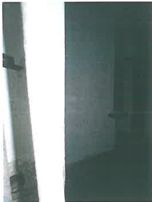
Wejście do młyna, widok wnętrza – zdjęcia grupa projektowa