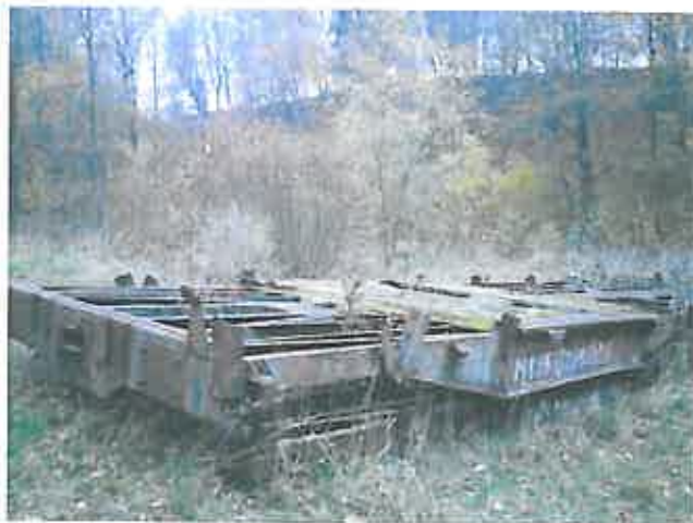
Platforma wagonowa w pobliżu młyna – zdjęcie grupa projektowa