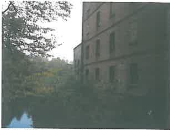
Widok młyna od strony rzeki – zdjęcie grupa projektowa