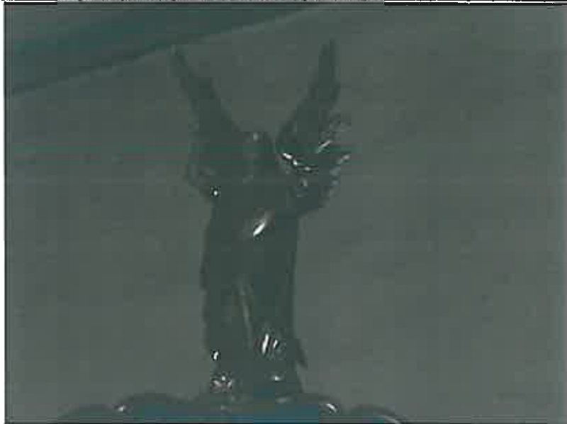
Figurka anioła zwieńczenie jednego z ołtarzy bocznych