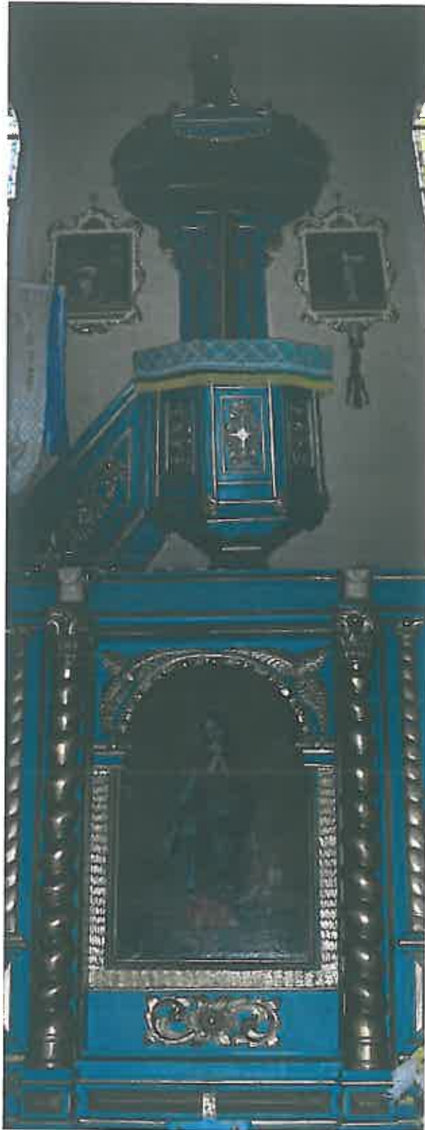
Ambona, obraz z ołtarza bocznego – zdjęcie grupa projektowa

W skutek działań hitlerowców, opuszczających w 1945 roku tereny Polski, wnętrze kościoła zostało zniszczone (wybite szyby i zniszczone drzwi) i splądrowane. Skradziono bezpowrotnie srebrną 100 gramową paterę, 600 gramową srebrną puszkę i sukienkę z cudownej figury Matki Boskiej Wardęgowskiej. Wcześniej, w roku 1942 r., zostały zrabowane również bezpowrotnie dwa dzwony kościelne.