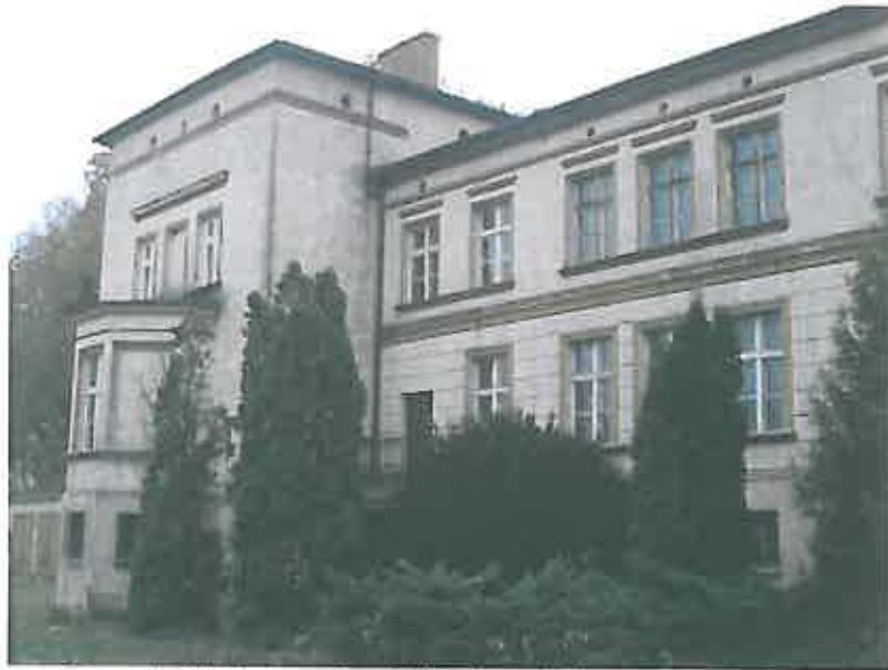
Dworek widok od parku, zbliżenie- zdjęcie grupa projektowa