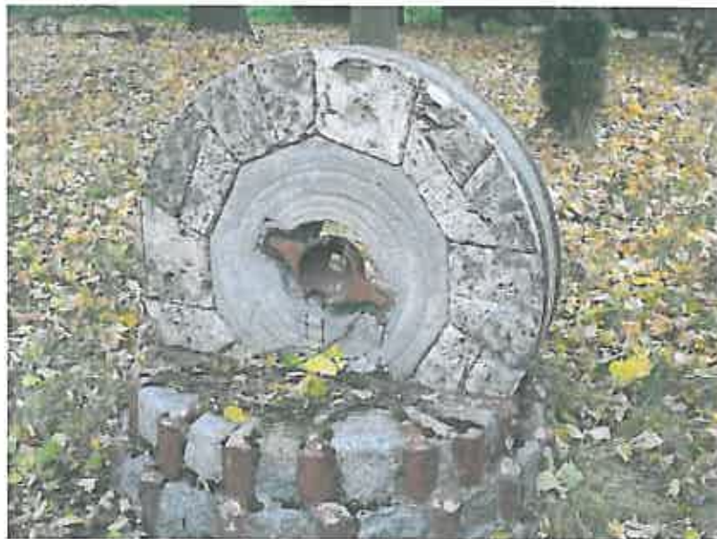
Kamień młyński – zdjęcie grupa projektowa

W 1885 roku w Ostrowitem powstało bractwo trzeźwości.