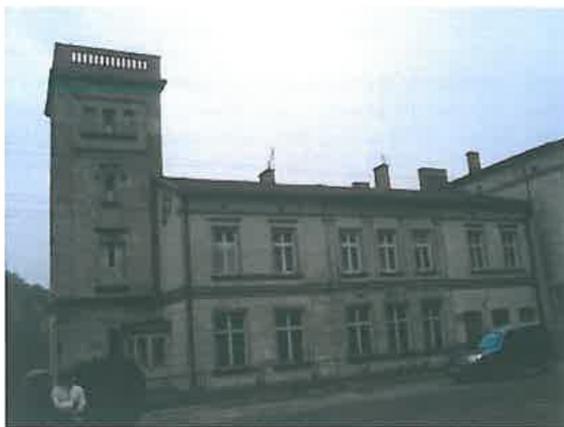
Dworek widok od strony ulicy, zbliżenie