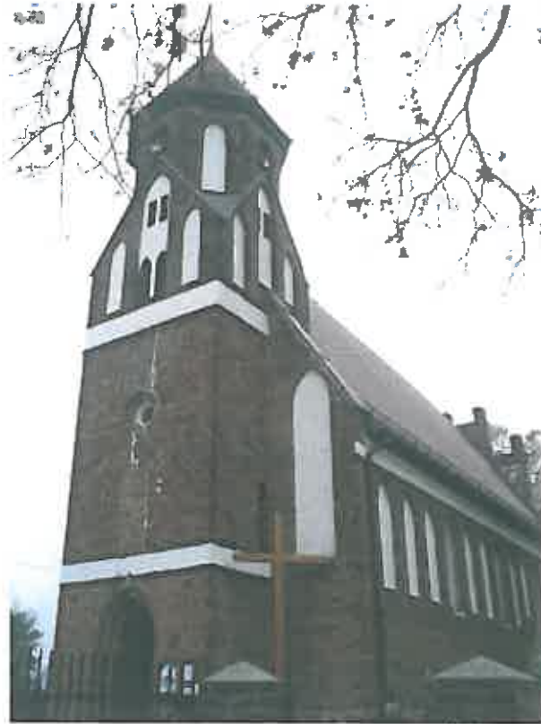
Widok od strony ulicy – zdjęcie grupa projektowa

Kościół gotycki, orientowany. Wzniesiony z cegły w układzie gotyckim z użyciem zendrówki w układzie rombowym w części prezbiterialnej, na kamiennej podmurówce. Korpus jednonawowy w kształcie prostokąta z wydzielonym prezbiterium. W część zachodnią kościoła kwadratowa, trójkondygnacyjna wieża. Ściany kościoła zdobią ostrołukowe, tynkowane blendy, okna profilowane od strony południowej. W elewacji wschodniej szczyt schodkowy ze sterczynami, z trzema parami tynkowanych blend rozdzielonych ukośnymi lizenami. W ścianach wieży otwory szczelinowe ze szczytami zdobionymi tynkowanymi blendami z tynkowanym fryzem opaskowym. Nad szczytami wieża przybiera kształt ośmioboku z większymi półkolistymi i ostrołukowymi oknami. Ściana północna jest ośmioosiowa posiada trzy okna w osiach skrajnych oraz czwarte od zachodu, w osi trzeciej od wschodu mieści się uskokowy portal z tynkowaną blendą. W innych osiach również blendy. Część wschodnią ściany zakrywa bryła otynkowanej zakrystii. Ściana południowa jest sześćoosiowa. Dach kościoła dwuspadowy pokryty dachówką klasztorną i rzymską, natomiast zakrystia dachem pulpitowym, a wieża ostrosłupowym z dachówką karpiońską ułożoną w koronkę. Strop świątyni pokryty polichromowanym kasetonem, strop kruchty podwieżowej sklepienie krzyżowe natomiast strop zakrystii belkowy z wsuwakami.