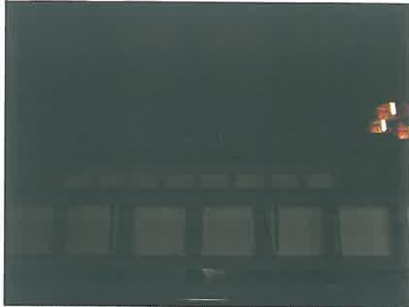
Organy na podbudowie części starych organów – zdjęcie grupa projektowa