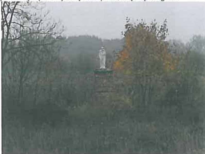
Pozostałość po szpitalu wojskowym – zdjęcie grupa projektowa

Za kościołem znajdował się szpital wojskowy. Dziś pozostała już tylko figurka św. Józefa.