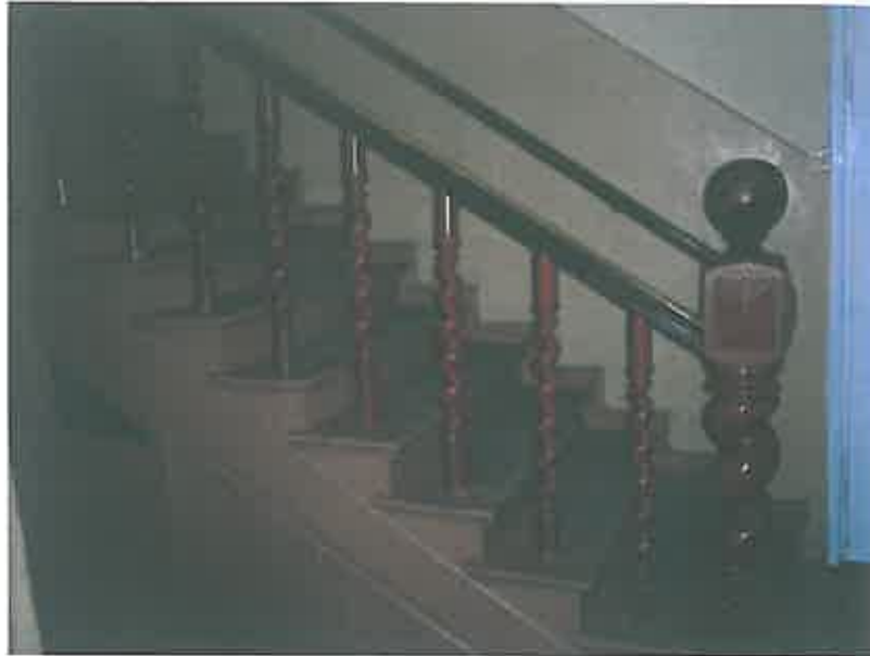
Wnętrze dworku – zdjęcie grupa projektowa