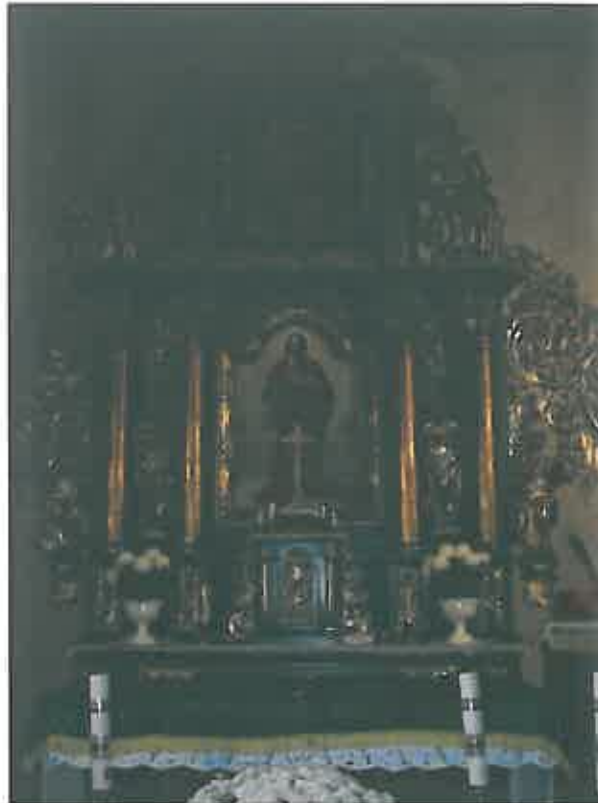
Fragment drogi krzyżowej, widok ołtarza głównego