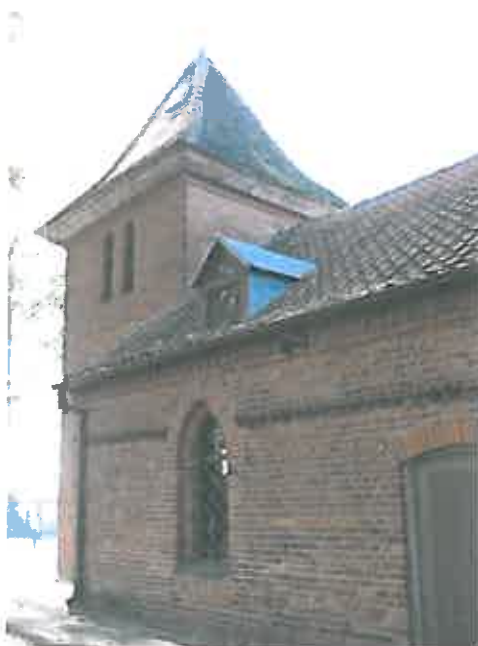
Wejście główne oraz widok od strony cmentarza