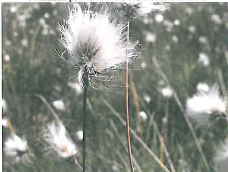
Wełnianka pochwowata w rezerwacie Kociołek