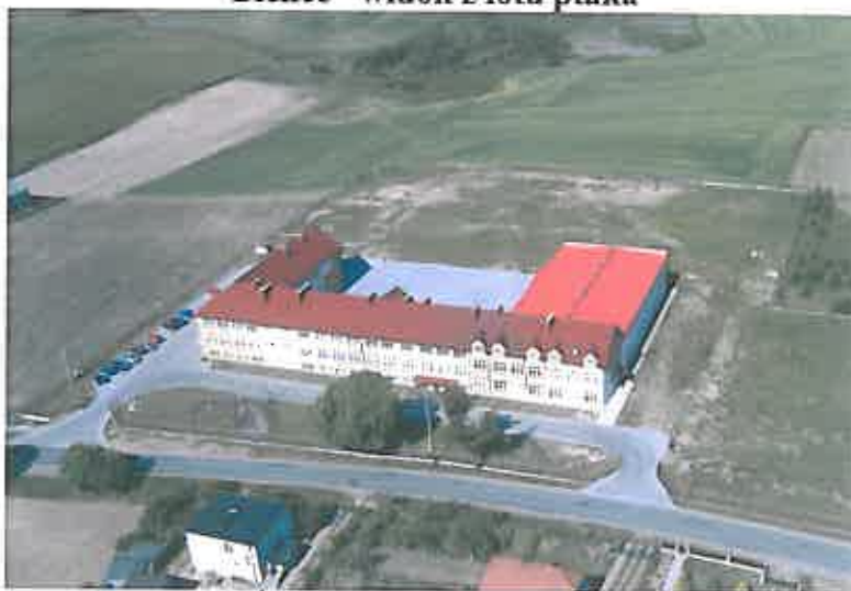
Bielice - widok z lotu ptaka

Obszar miejscowości Bielice należy do miejscowości, w których na przestrzeni lat układ przestrzenny został zaburzony. Część zabudowy mieszkalnej zachowała częściowy charakter historyczny: bryła, kształt dachu. Jednakże większość elementów uległa zatraceniu. W centrum wsi dominuje bryła współczesnego gimnazjum publicznego. Na obrzeżu charakterystyczną formę reprezentuje zespół stacji kolejowej wraz z wieżą ciśnień.