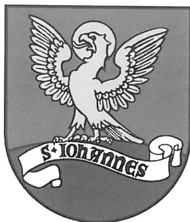
Tabela przełożenia kolorów – CMYK

W polu czerwonym na wzgórzu zielonym orzeł złoty ze wznoszonymi skrzydłami ze złotą aureolą , trzymający w szponach białą wstęgę z czarnym Łacińskim napisem : „ S. Johannes „ ( św. Jan ).