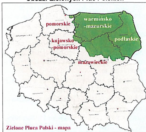
Obszar Zielonych Płuc Polskich

Cały teren Gminy Biskupiec jak i województwa warmińsko-mazurskiego znajduje się w granicach obszaru funkcjonalnego Zielone Płuca Polski. Celem jego istnienia jest promowanie rozwoju proekologicznego, utrzymanie zrównoważonych struktur przestrzennych dla zapewnienia wysokiego standardu środowiska przyrodniczego. Obszar objęty jest porozumieniem działań na rzecz ekorozwoju Zielone Płuca Polski. Zajmuje obecnie 63 235 km 2 , co stanowi około 20,0 % powierzchni kraju, a zamieszkuje go prawie 4.0 mln osób, co stanowi 9,7 % ludności kraju. Położony jest w północno-wschodniej jego części, obejmując województwa warmińsko-mazurskie i podlaskie oraz części województw: mazowieckiego, kujawsko-pomorskiego i pomorskiego. Podstawą delimitacji obszaru były jedne z najcenniejszych w kraju i Europie systemy ekologiczne. Ze względu na pragmatykę realizacji wspólnych przedsięwzięć, umowną granicę zewnętrzną stanowią granice administracyjne gmin.