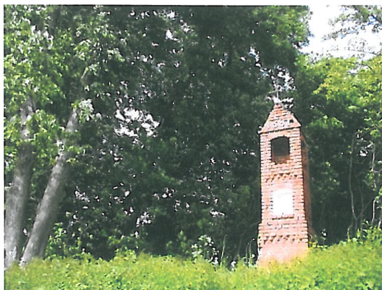
Cmentarze historyczne na terenie miejscowości Podlasek

Kapliczka z 1881 roku wraz z cmentarzem. Za kapliczką, w kępie drzew kryją się groby byłych mieszkańców Podlaska.